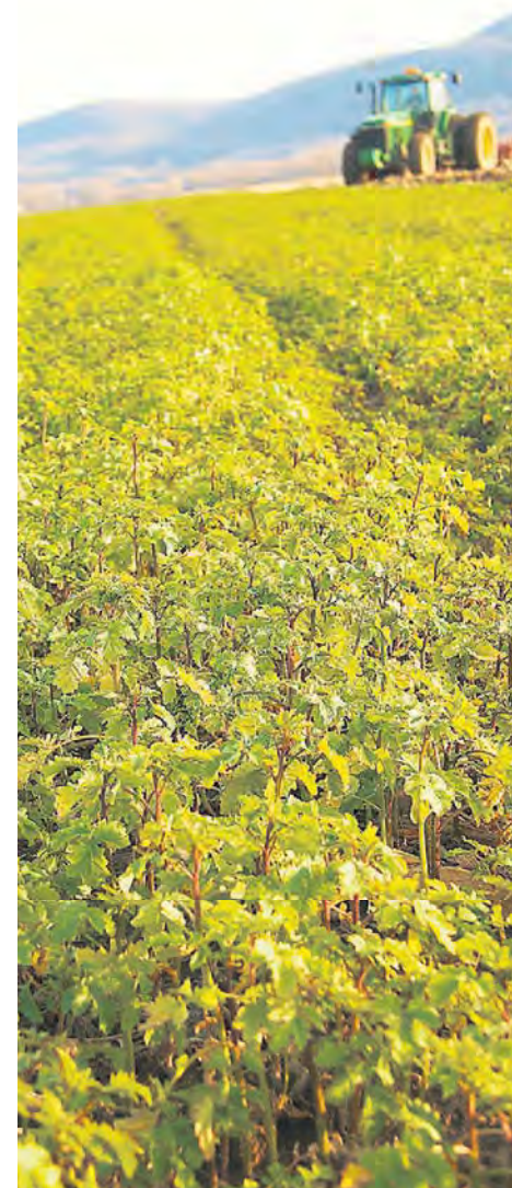
L'utilisation des engrais verts a des effets bénéfiques indéniables sur les sols.

Ce projet d'essais d'engrais vert a été entrepris par le Club des rendements Optimum de Bellechasse (CROB). Le CROB, qui fête ses 20 ans d'existence cette année, accompagne plus de 200 entreprises agricoles de la région de la Chaudière-Appalaches dans la mise en place de bonnes pratiques agricoles à la ferme. ■